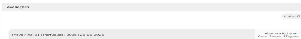
Figura 2 – Acesso à prova a realizar

11.11. Nas provas ao clicar em “Iniciar sessão”, por exemplo, para um aluno que realiza a prova-ensaio de Português (91), aparece o seguinte ecrã: