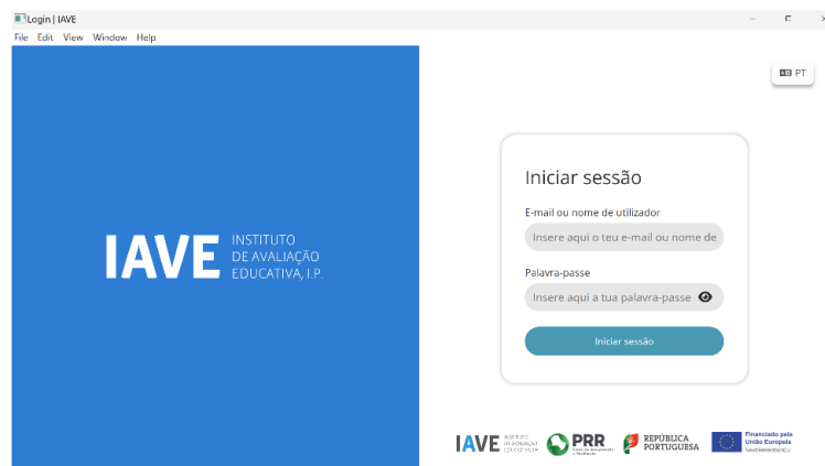
Figura 1 – Acesso à Plataforma de Realização das Provas Eletrónicas do IAVE

c) Inserir as credenciais “Nome de utilizador” e “Palavra-passe” e, em seguida, clicar em “Aceder” ou “Iniciar sessão”.